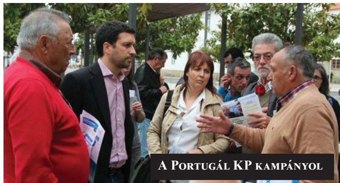
A PORTUGÁL KP KAMPÁNYOL

Amint a fenti rövid ismertetőből láttuk, a pártok lehetőségei eltérőek, és az indulási feltételek is különböznek az egyes országokban, így a pártok többféle módon használják ki a választási lehetőséget.