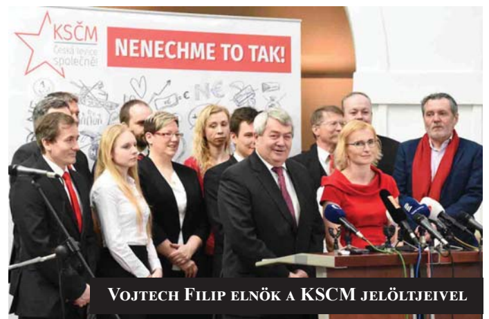
VOJTĚCH FILIP ELNÖK A KSCM JELŐLTJEIVEL

Az EP-választáson a párt a „KSČM – Česká levice spojeň!” (KSČM - Együtt a cseh baloldal!) választási blokk keretében indul. A kommunista párt mellett tagja a Demokratikus Szocializmus Pártja, Csehszlovákia Kommunista Pártja és a SPaS (Munka és Szolidaritás Egyesülés). Közös jelszó: Ne hagyjuk a dolgokat annyiban! (Nenechme to tak!) A listát Kateřina Konečná vezeti, aki eddig is EP-képviselő volt. A küzdelem a 3 mandátum, de legalább 2 hely megtartásáért folyik.