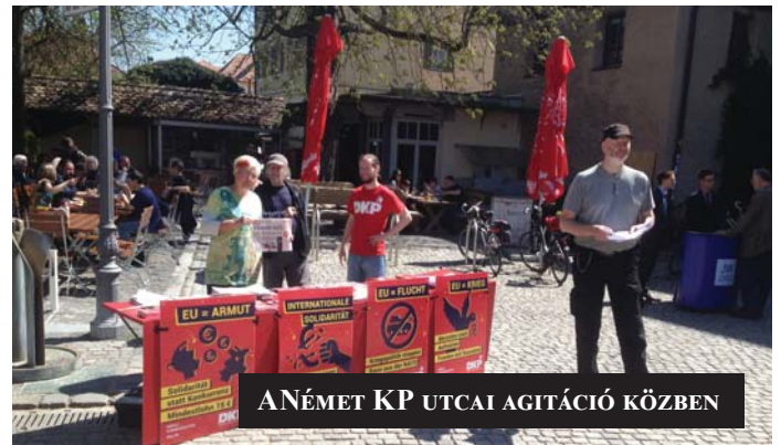
ANÉMET KP UTCAI AGITÁCIÓ KÖZBEN

Öt éve a Portugál KP 12,7 százalékot kapott és 3 mandátumhoz jutott. A mostani előrejelzések szerint 12-13 százalék között várható az eredményük, ami 2 mandátumot eredményezhet.