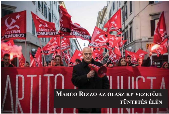
MARCO RIZZO AZ OLASZ KP VEZETŐJE TŰNTETÉS ÉLÉN

Május 26-án az Európai Unió minden országának polgárai megválasztják képviselőiket az Európai Parlamentbe. A választás az európai kommunista és munkáspártok számára is fontos esemény. Az egyes pártok eltérően ítélik meg az Európai Parlamentet, sőt magát az Európai Uniót is, de maga a választás jó lehetőség a kommunista és munkáspártok programjának megismertetésére, a pártok szervezeti erősítésére, új aktivisták és támogatók megtalálására. Vessünk egy pillantást néhány európai párt tapasztalataira! Hogy állnak most, hogy készülnek és mire készülnek?