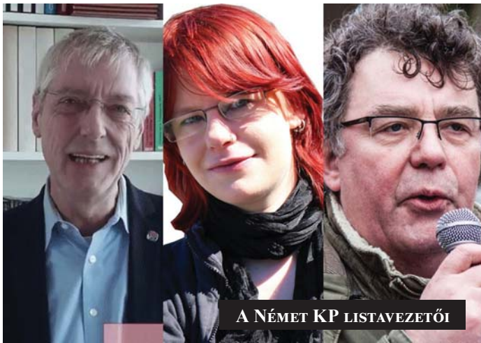
A NÉMET KP LISTAVEZETŐI

A Görög KP Demetris Koutsoubas, a Görög KP főtítkárának vezetése alatt ma Európa egyik legerősebb kommunista pártja, a mozgalom egyik meghatározó tényezője. A legutóbbi EP-választásokon 6,11 százalékot szerzett és 2 képviselőt tudott az EP-be juttatni. A Görög KP az EP-tagságból adódó lehető-