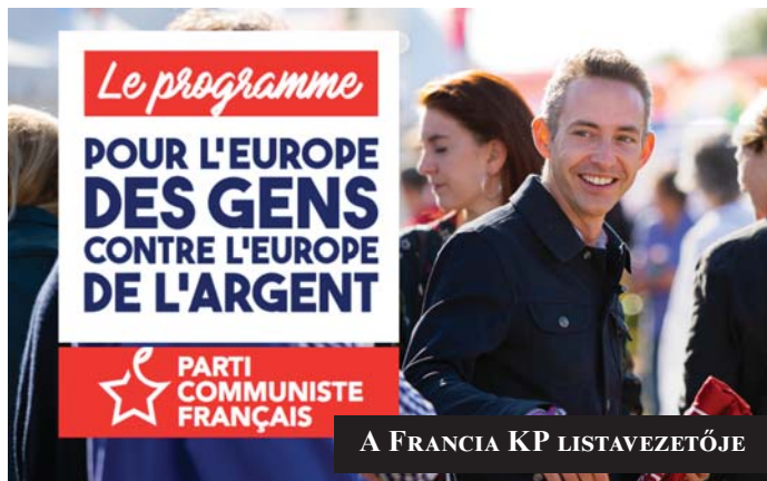
A FRANCIA KP LISTAVEZETŐJE

A Francia KP listavezetője a 39 éves hivatásos politikus Ian Brossat, aki Párizs szocialista polgármestere mellett az alpolgármesteri teendőket látja el. Vezető gondolatuk: „A népek Európájáért, a pénz Európája ellen!” (Pour une Europe des gens, contre l'Europe de l'argent). Franciaországban a bejutási