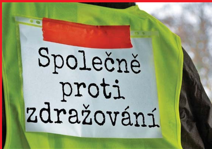
CSEH-ÉS MORVAORSZÁG KOMMUNISTA PÁRTJA JANUÁR 26-ÁN UTCAI TŰNTETÉSEN KÍVÁN TILTAKOZNI A CSEHORSZÁGI ÁREMELÉSEK ELLEN.