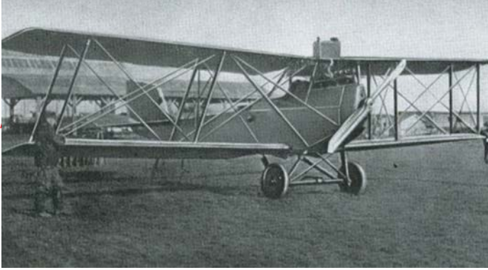
A BRANDENBURG C.I TÍPUSÚ REPÜLŐ