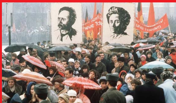
100 ÉVVEL EZELŐTT, 1919. JANUÁR 15-ÉN GYILKOLTÁK MEG BERLINBEN A NÉMET KOMMUNISTA PÁRT KÉT VEZETŐJÉT, ROSA LUXEMBURGOT ÉS KARL LIEBKNECHTET. A NÉMET KOMMUNISTÁK ÉS MÁS BALOLDALI ERŐK SOKEZRES FELVONULÁSSAL EMLÉKEZTEK AZ ESEMÉNYRE.