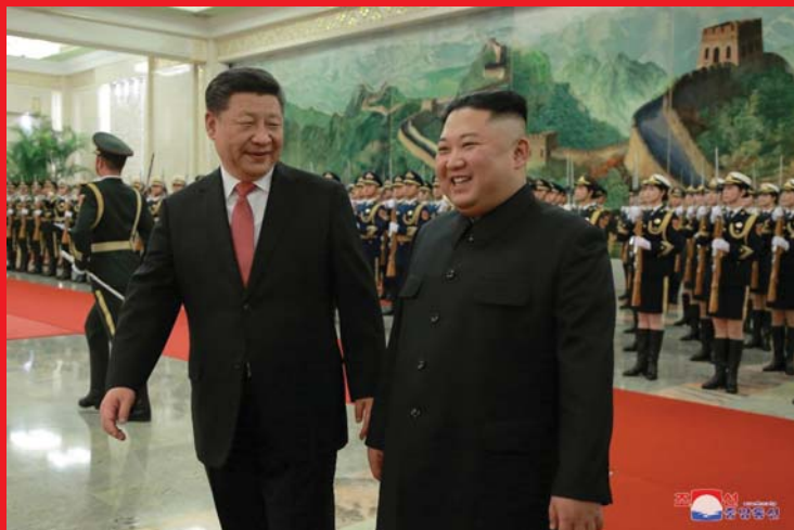
CSÚCSTALÁLKOZÓRA KERÜLT SOR PEKINGBEN HSZI CSING-PING, A KÍNAI KP FŐTITKÁRA, ÁLLAMELNÖK ÉS KIM DZSONGUN, A KNDK LEGFELSŐBB PÁRT-ÉS ÁLLAMI VEZETŐJE KÖZÖTT.