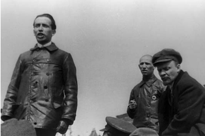
SZAMUELY TIBOR ÉS LENIN A VÖRÖS TÉREN

Nos, innen, az albertfalvai reptérről indult Moszkvába 1919. május 17-én Szamuely Tibor, a Tanácsköztársaság hadügyi népbiztosa, azaz minisztere. A Lenin vezette Szovjet-Oroszország és Magyarország között akkor nem volt közvetlen szárazföldi összeköttetés, mivel Ukrajna német megszállás, illetve különböző fegyveres bandák ellenőrzése alatt volt. Lenin és Kun Béla, a Tanácsköztársaság külügyi népbiztosa és tulajdonképpeni vezetője szikratávíron tartotta a kapcsolatot. Mindkét kormány érezte annak égető szükségességét, hogy közvetlen személyes tárgyalásra kerüljön sor.