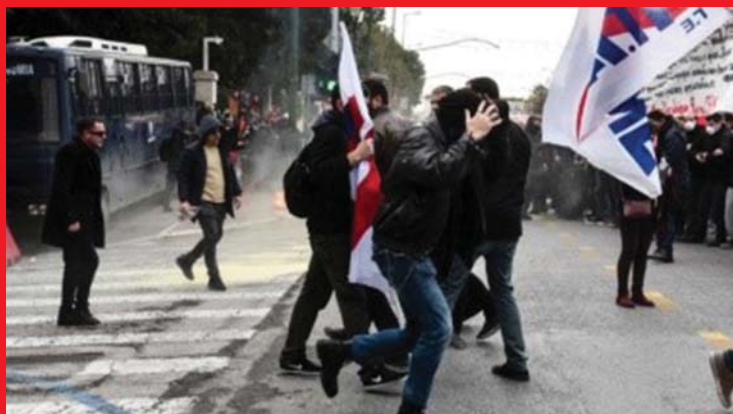
JANUÁR 11-ÉN A GÖRÖG TANÁROK ATHÉNEN SZTRÁJKOT ÉS TŰNTETÉST TARTOTTAK. A MAGÁT BALOLDALINAK NEVEZŐ SZIRIZA-KORMÁNY UTASÍTÁSÁRA A RENDŐRSÉG BRUTÁLISAN SZÉTVERTE A TŰNTETÉST.