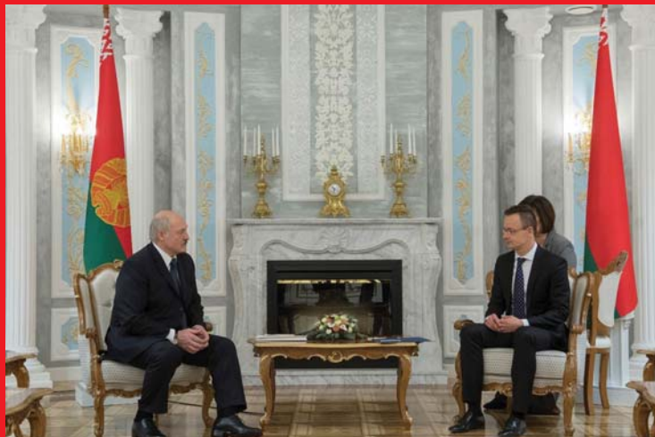
ALEKSZANDR LUKASENKO BELARUSZ ELNÖK FOGADTA SZIJJÁRTÓ PÉTER MAGYAR KÜLGAZDASÁGI ÉS KÜLÜGYMINISZTERT. EZ HOSSZÚ IDŐK ÓTA A LEGMAGASABB SZINTŰ ÉRINTKEZÉS A KÉT ORSZÁG KÖZÖTT.