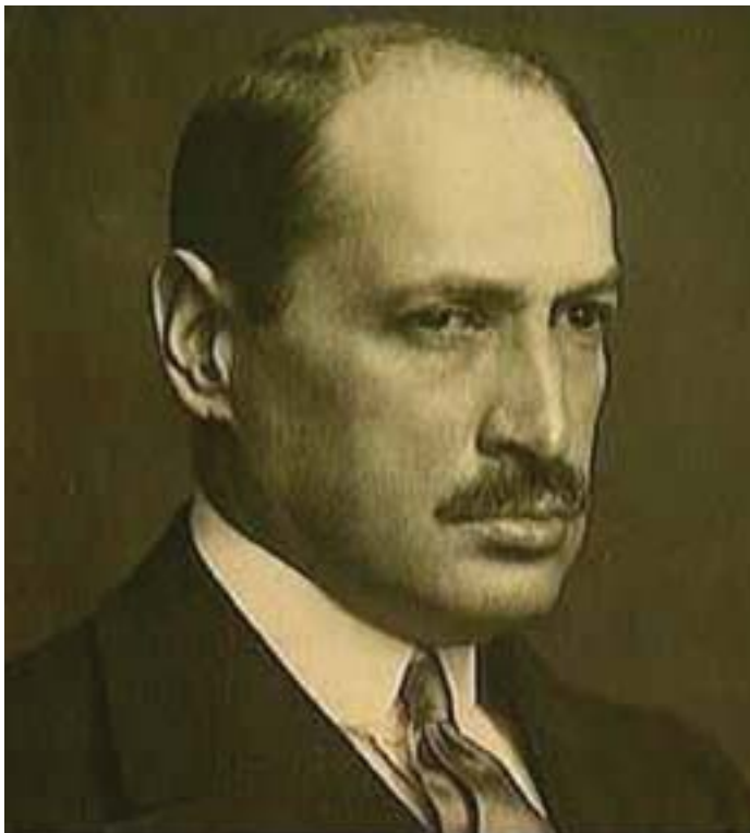
KÁROLYI MIHÁLY GRÓF

Száznegyven éve, 1875. március 4-én született Károlyi Mihály gróf, Magyarország első köztársasági elnöke, miniszterelnök. Az egyik régi magyar arisztokrata család sarjaként Budapesten látta meg a napvilágot. A budapesti egyetemen doktorált jogból, majd bekapcsolódott a szövetkezeti mozgalom szervezésébe. 1901-ben szabadelvű programmal indult a választáson, 1905-ben győzött a pétervásári választókerületben, de egy év múlva már nem jutott mandátumhoz. 1910-ben pártonkívüli függetlenségi programmal került be ismét a parlamentbe a kápolnai kerület képviselőjeként. Károlyi élesen bírálta Tisza István erőszakos, az ellenzéki obstrukciót letörni akaró politikáját, 1913-ban egy szóváltásuk után párbajoztak is. 1914-ben elvette a nála húsz évvel fiatalabb, szintén baloldali elkötelezettségű Andrássy Katinka grófnőt, aki élete végéig hű társa maradt.