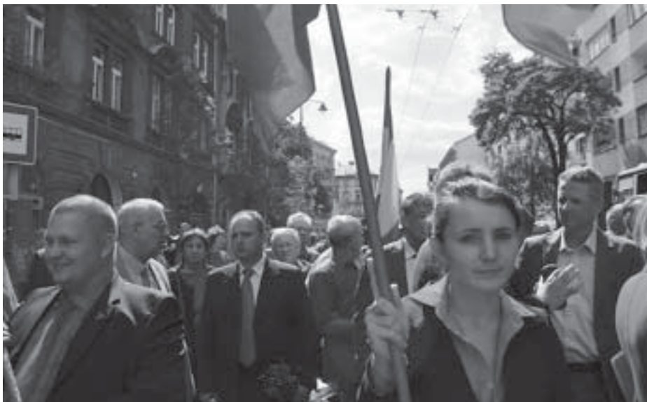
SZLOVÁK, OSZTRÁK, OROSZ VENDÉGEK A 24. KONGRESSZUSON

2013-ban Moszkvában felsőszintű megbeszélésre került sor az Orosz Föderáció Kommunista Pártjának vezetésével. Részt vettünk az Osztrák Munkapárt alapító kongresszusán. 2014-ben a Német Kommunista Párt vezetőivel tárgyaltunk Berlinben.