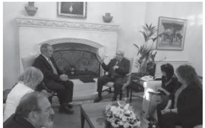
A MUNKÁSPÁRT KÜLDÖTTSÉGE A CIPRUSI ELNÖKNÉL

Portugáliában, 2014-ben Ecuadorban került sor a találkozóra.