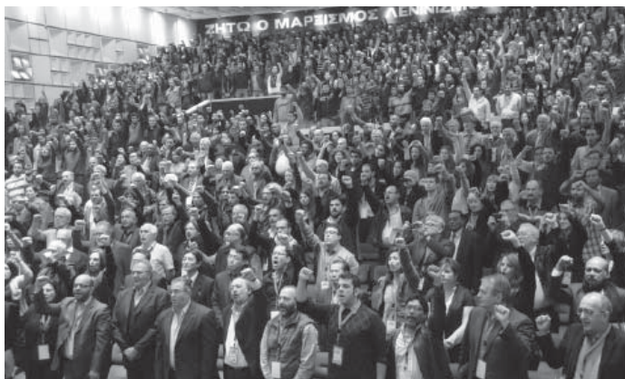
A GÖRÖG KOMMUNISTA PÁRT NAGYGYŰLÉSE

A beszámolási időszakban is aktív részei voltunk a Kommunista és Munkáspártok Nemzetközi Találkozóinak. 2011-ben Görögországban, 2012-ben Libanonban, 2013-ban