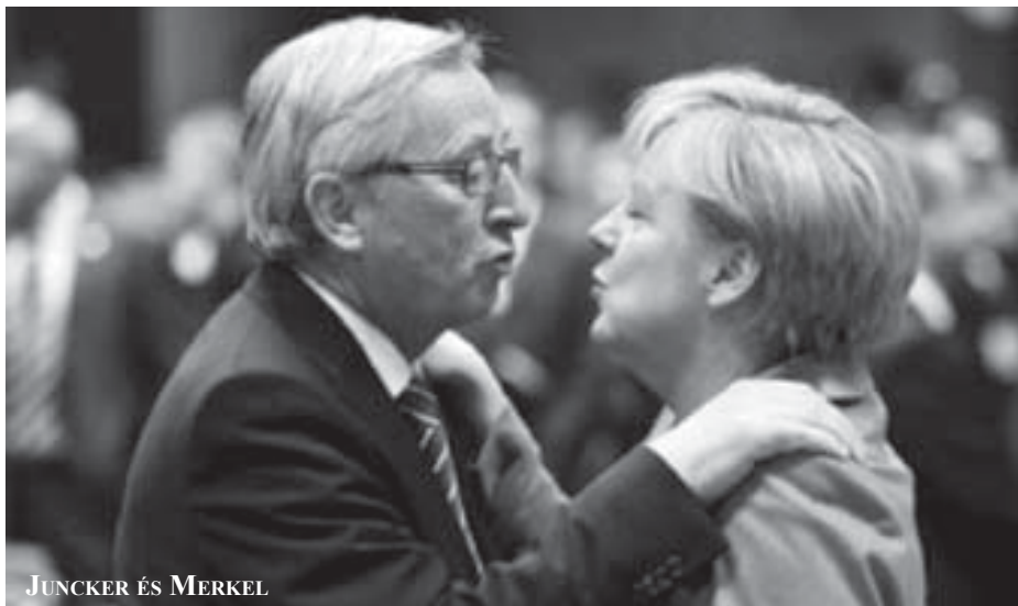
JUNCKER ÉS MERKEL

Oknyomozó újságírók tárták fel, hogy több száz vállalat kötött titkos adómegállapodásokat a luxemburgi adóhivatallal. Ezek értelmében lehetőségük nyílt arra, hogy a más országokban befizetendő adóterheknek többnyire elenyésző hányadát fizessék csak be a nagyhercegségben. Jean-Claude Juncker egészen tavaly decemberig, 18 éven át volt az ország miniszterelnöke, 1989 és 2009 között, részben a miniszterelnökséggel párhuzamosan pedig a pénzügyminiszteri feladatokat is ő látta el. Érdekes megfigyelni, hogy milyen cégekről derült ki, hogy benne voltak Juncker machinációjában: 340 multinacionális cégről van szó, köztük olyan ismertekről is, mint a PepsiCo, az AIG, a Deutsche Bank, az Apple, az Amazon vagy az IKEA.