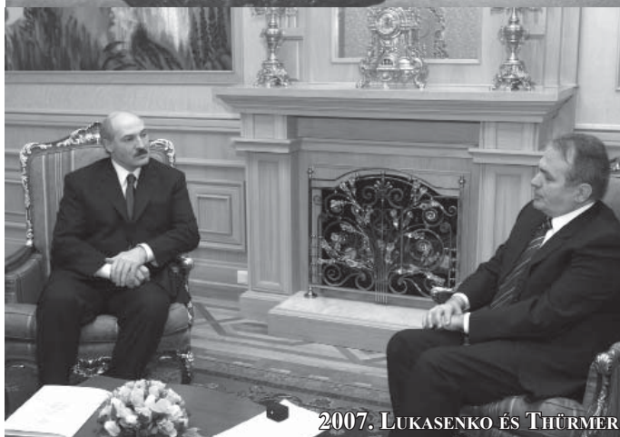
2007. LUKASENKO ÉS THÜRMER