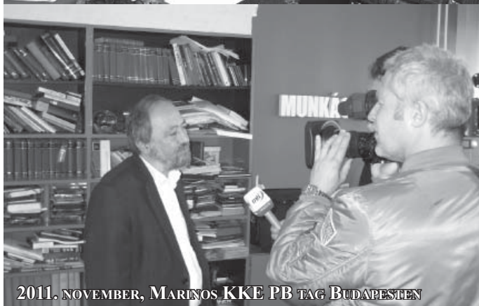
2011. NOVEMBER, MARINOS KKE PB TAG BUDAPESTEN