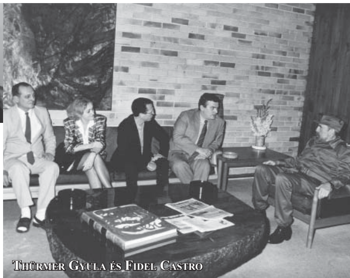
THÜRMER GYULA ÉS FIDEL CASTRO