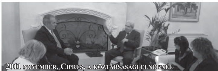
2011 NOVEMBER, CIPRUS, A KÖZTÁRSASÁGI ELNÖKNÉL