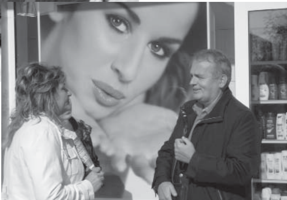
VÁLASZTÁSI KAMPÁNY TATABÁNYÁN

Folytatjuk harcunkat, mert hiszünk abban, hogy lehet olyan világot teremteni, ahol nem a pénz, nem a tőke uralkodik, hanem a dolgozó emberek. Hiszünk benne, mert tudjuk, hogy nekünk a mai világ nem jó. A munkanélküliség, a szegénység forrása maga a tőkés rendszer. Hiszünk benne azért is, mert elődeink egyszer már megcsinálták. ■