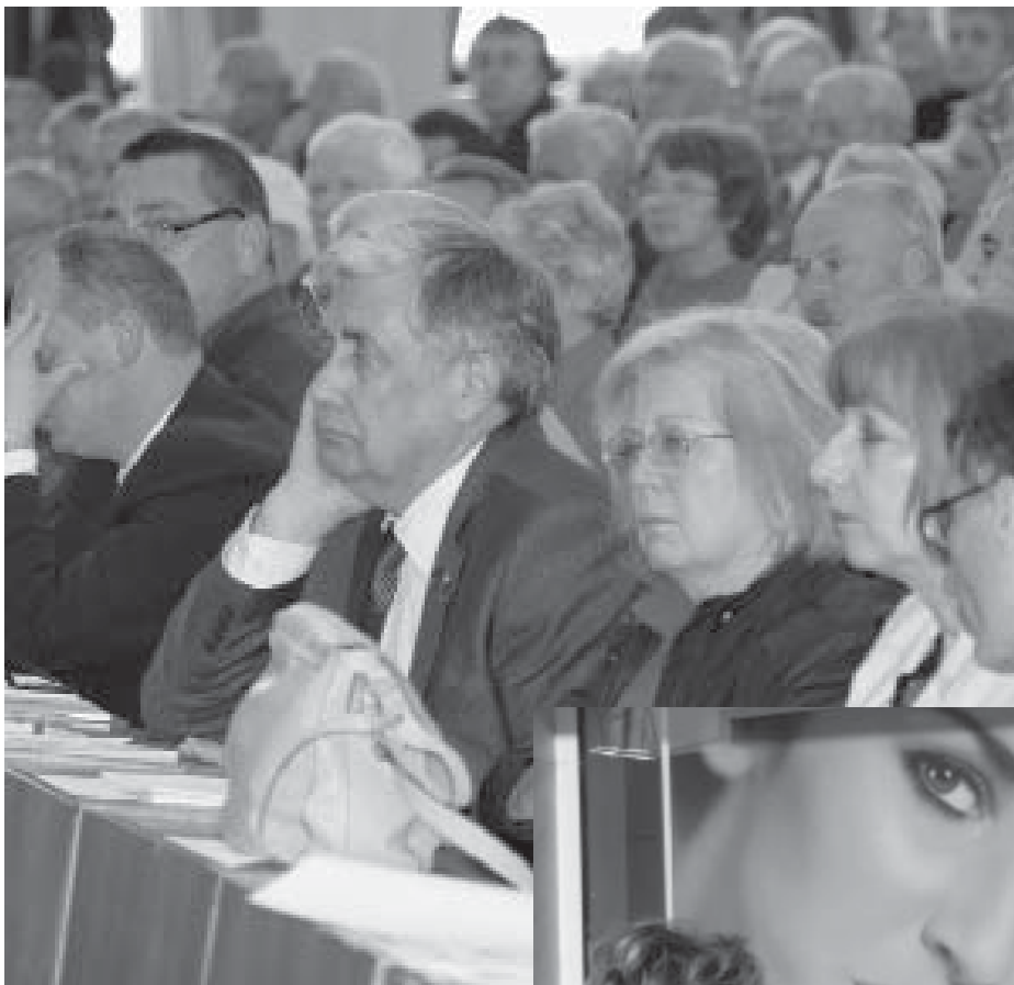
KÜLFÖLDI VENDÉGEK A 24. KONGRESSZUSON

válik: minden erőnket centralizálni kell. A párt budapesti központjának működnie kell, mert innen mehetnek impulzusok, amelyek előreviszik a pártot. A párt 24. kongresszusa 2012 tavaszán elfogadja a párt új programját. Új gondolatok, új megfogalmazások, új jelképek!