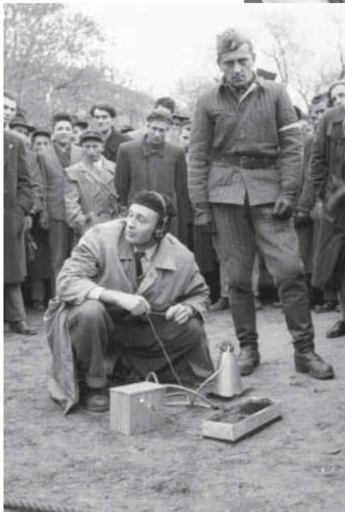
MÁR 1956-BAN IS KERESTÉK A KAZAMATÁKAT, AKKOR SEM TALÁLTÁK