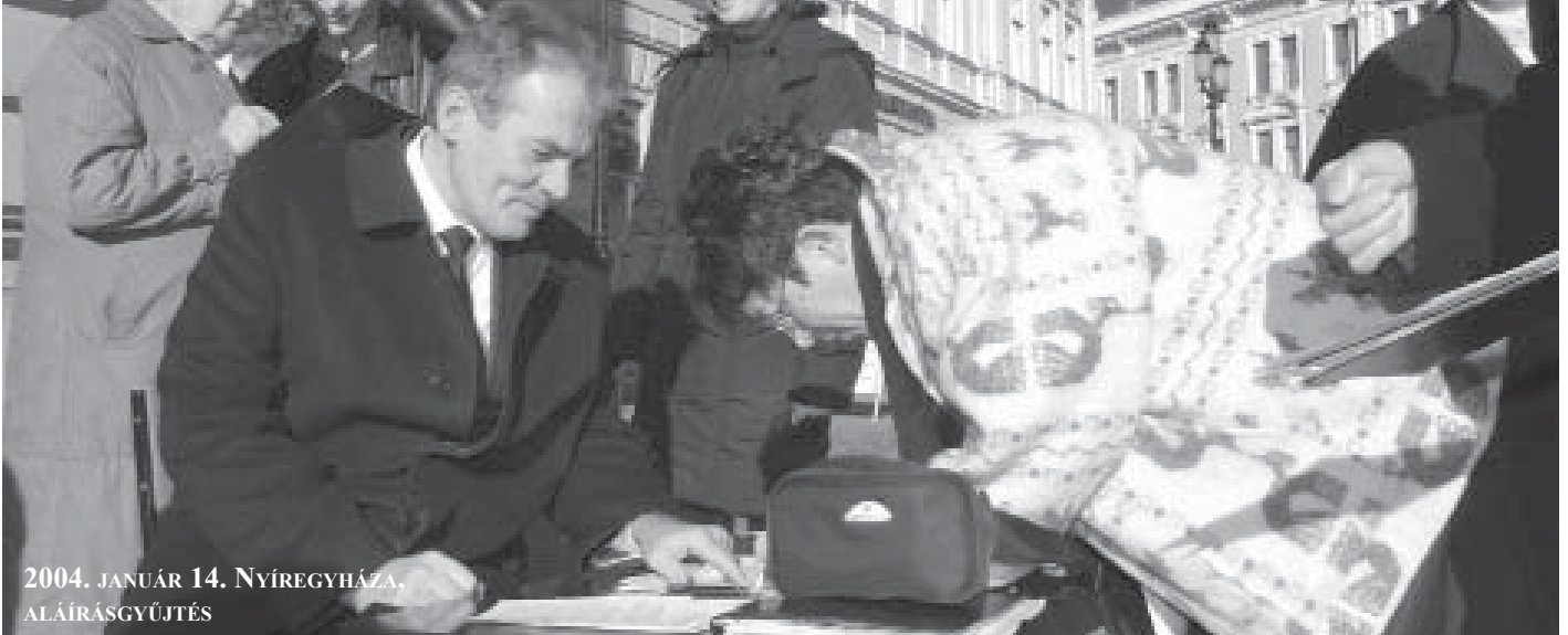
2004. JANUÁR 14. NYÍREGYHÁZA, ALÁÍRÁSGYŰJTÉS

Huszonöt esztendeje, 1989. december 17-én született újjá a Magyar Munkáspárt. Sok ezer tisztességes kommunista, becsületos, egyszerű ember vállalta, hogy nemet mond a kapitalizmusra, kitart a szocializmus mellett. A Munkáspárt újjászületése az ő történelmi érdemük. Nagyszerű tettük emlékét megőrizzük, és erőt merítünk belőle mai harcunkhoz.