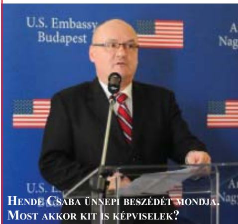
HENDE CSABA ÜNNEPI BESZÉDÉT MONDJA. MOST AKKOR KIT IS KÉPVISELEK?