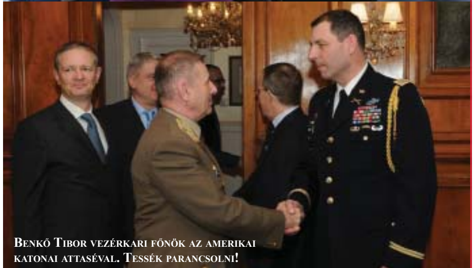
BENKŐ TIBOR VEZÉRKARI FŐNÖK AZ AMERIKAI KATONAI ATTASÉVAL. TESSÉK PARANCSOLNI!