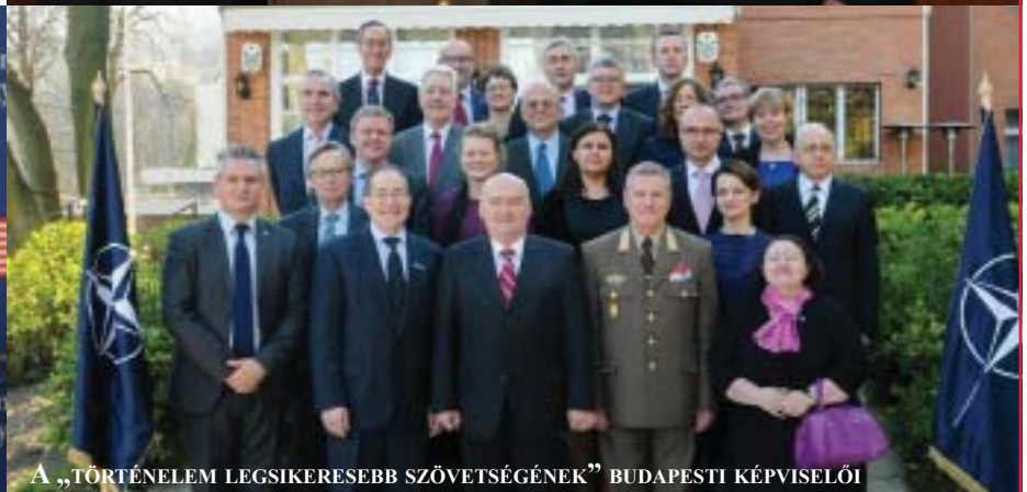
A „TÖRTÉNELEM LEGSIKERESEBB SZÖVETSÉGÉNEK” BUDAPESTI KÉPVISELŐI

A Magyar Munkáspárt központi politikai lapja. Szerkeszti a szerkesztőbizottság.