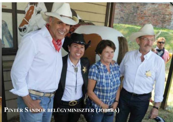
PINTÉR SÁNDOR BELÜGYMINISZTER (JOBBRA)