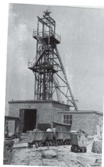
BARANYAI BÁNYA EGYKOR

A megyei gazdaság fejlesztésének fontos irányát jelenthették volna a magyar vállalkozások. A regisztrált