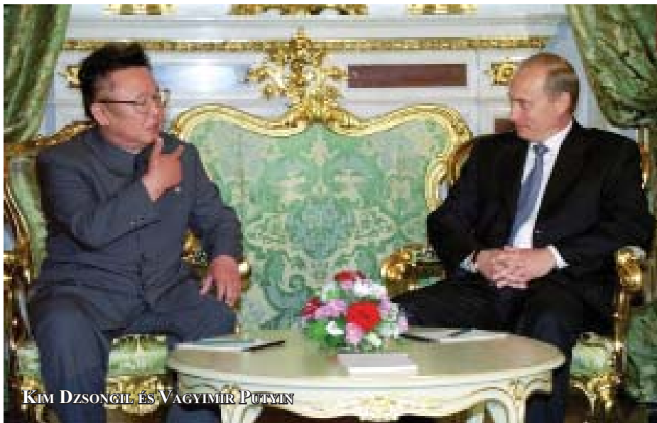
KIM DZSONGIL ÉS VAGYIMIR PUTYIN

Kim Dzsongil 17 éven át vezette a KNDK-t. Nem sikerült gazdag állammá tenni, de jobbá tette az emberek életét. A rendkívül zárt ország fokozatosan nyitott a világ felé. A történelmileg szegény Koreát egymás után sújtották a természeti katasztrófák is. A KNDK azonban túlélte. A rengeteg munka, az ország vezetése fokozatosan felőrölte Kim Dzsongil egészségét. 2011-ben távozott el. Egy fejlődésnek és változásnak indult szocialista országot hagyott hátra. Örökébe fia, Kim Dzsongun lépett, akit fiatal kora ellenére gyorsan elfogadott a koreai politikai és társadalmi élet. Az elmúlt két évben világosan letette a voksot egy korszerű, egységes, és független szocialista KNDK megteremtése mellett. ■