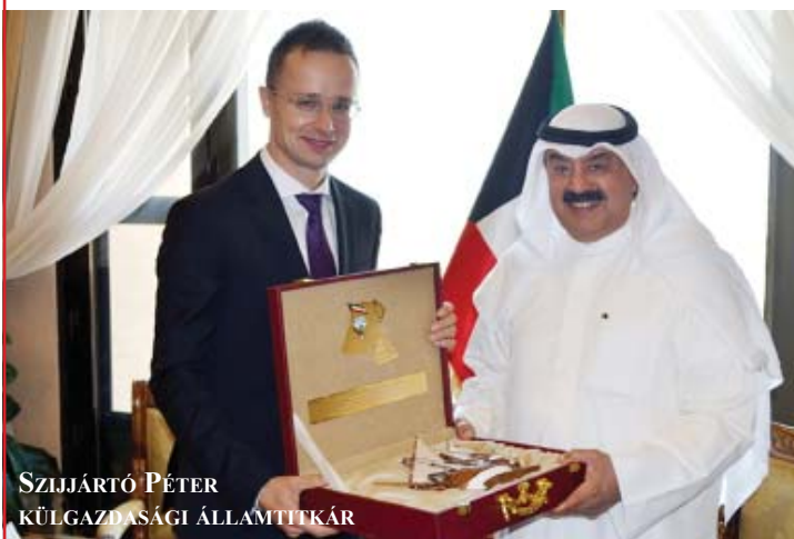
SZIJJÁRTÓ PÉTER KÜLGAZDASÁGI ÁLLAMTITKÁR

asa. Felháborító és undorító! A magyarok többsége 100 ezer forintot vagy annál kevesebbet kap, milliók élnek a szegénységi küszöb körül, a kormánytagok meg gazdagodnak. A dupla- és triplafizetések erkölcsstelenek. A külföldi napidíjak felvétele akkor, amikor külföldön ellátják a delegációkat, egyenesen vérlázító. A Munkáspárt szerint a miniszteri fizetés a minimálbér legfeljebb háromszorosa legyen!