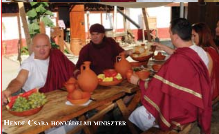
HENDE CSABA HONVÉDELMI MINISZTER