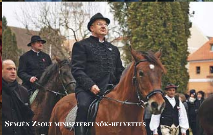
SEMJÉN ZSOLT MINISZTERELNÖK-HELYETTES