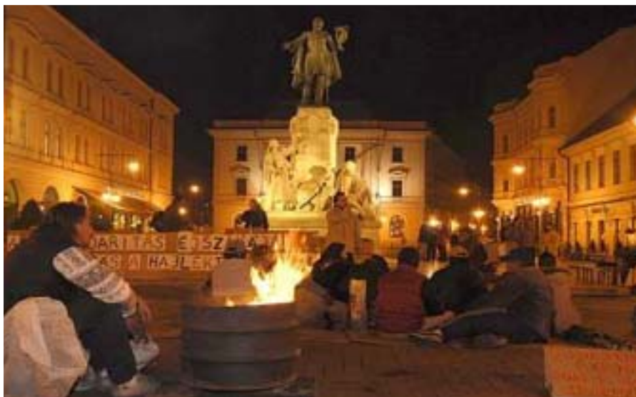
SZEGED, 2006. NOVEMBER 16. A SZOLIDARITÁS ÉJSZAKÁJA CÍMMEL SZEGEDI EGYETEMISTÁK ÉS A VÉDEGYLET ÖNKÉNTESEI TARTANAK HAJNALIG TARTÓ VÍRSZÁRTÁST HAJLÉKTALANOKKAL A HAJLÉKTALANOKÉRT SZEGED BELVÁROSÁBAN.