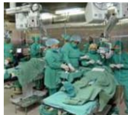
KUBAI ORVOSOK, AMINT SZEM MŰTÉTET VÉGEZNEK AZ OPERACIÓ MILAGRO, AZAZ A CSODÁS MŰVELET KERETÉBEN, KITŰNŐ TECHNIKAI FELSZERELTSÉGGEL ÉS HOZZÁÉRTÉSSEL

Természetesen az elithez tartozó orvosok hevesen tiltakoznak. Bolíviában, Hondurasban és Uruguayban a helyi orvosszövetségek "tiszteletlen verseny támasztásával" vádolják az ingyen dolgozó kubai orvosokat.