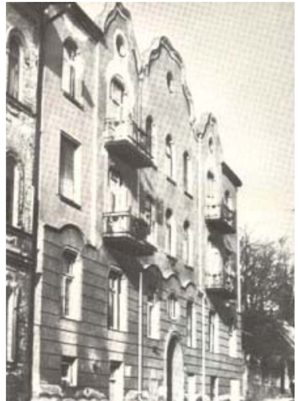
VÁROSMÁJOR UTCA 42. ITT ALAKULT MEG NOVEMBER 24-ÉN A KOMMUNISTÁK MAGYARORSZÁGI PÁRTJA

A proletárdiktatúra megdöntése után a KMP illegitimitásba kényszerült, de minden üldöztetése ellenére is hazánk komoly tényezője maradt. Ott volt mindenütt és mindenkor, amidőn a dolgozókért kellett kiállni. A horthysta hatóságok külön politikai osztályt hoztak létre az illegális kommunisták ártalmatlanná tételére. Hiába, mert az elesettek, vagy bebörtönzöttek helyére mások léptek, akik folytatták a harcot. Ott voltak a fasizmus és a háború elleni harc élvonalában. Ez a heroikus küzdelem megtizedelte a pártot. A háború után élére álltak a népi demokrácia, majd a szocialista forradalomért folyó harcok. Napjaiban az egyetlen erő volt, mely rövid- és középtávon a dolgozók napi érdekeit képviselte, jövőbeli célja pedig a közösségi társadalom megvalósítása volt.