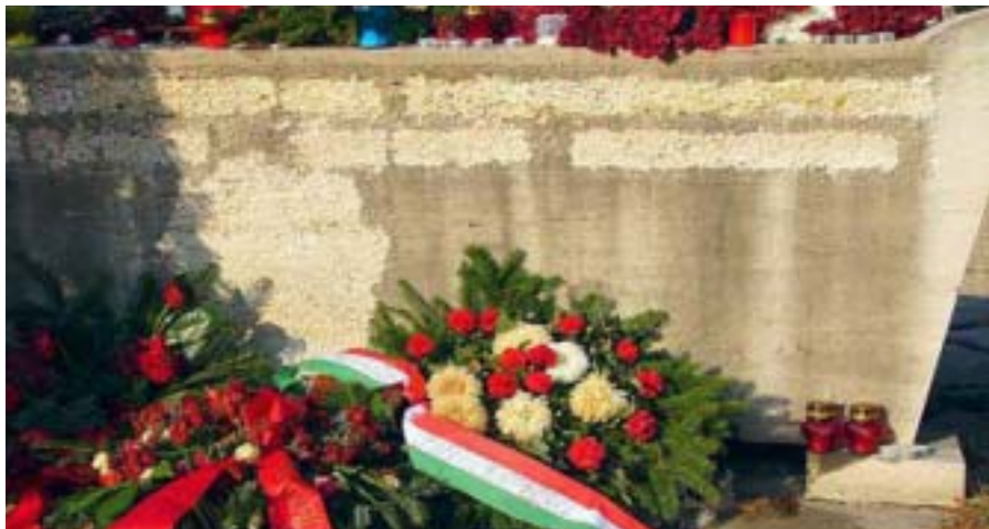
A LEVÉSETT SZARKOFÁG. A FELIRAT AZ ALÁBBI VOLT: ÖRÖK HÁLA ÉS DICSŐSÉG AZ ELLENFORRADALOM ELLENI HARCOKBAN ELESETT HŐSÖKNEK