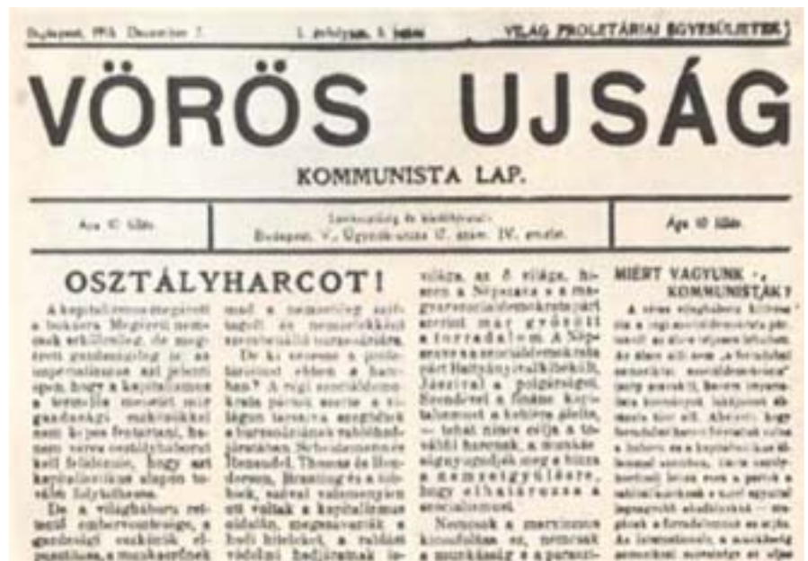
A KMP ELSŐ PROGRAMJA A PÁRT LAPJÁBAN, A VÖRÖS ÚJSÁGBAN

Éljen az új, a harmadik, a forradalomra fegyverkező igazi Internacionálé!