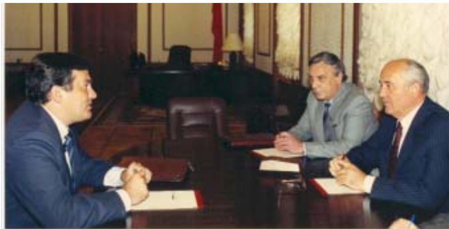
THÜRMER GYULA MOSZKVÁBAN MIHAIL GORBACSOV SZOVJET ELNÖKKEL ÉS JANAJEV ALELNÖKKEL. GORBACSOV MINDENKINEK MINDENT ÍGÉRT, S SEMMIT SEM TARTOTT BE.

A makói ünnepségről siettem a budapesti pártközpontba. Gyerekkoromban olvastam, hogy Kun Bélát a legváratlanabb helyzetben, a csepeli gyűjtőfogházban kérték fel kormányalakításra. Azóta vallom, hogy mindig elérhetőnek kell lenni, mert soha nem lehet tudni, mikor jön el a mi időnk. '91 nyarán a telefonrendszer még magán viselte a múlt nyomain. Vidéken nehéz lett volna elérni, ha valaki el akart volna érni. A Köztelek utcai pártházban, ami korábban a IX. kerületi pártbizottságnak adott otthont, rejtélyes okok miatt még be volt kötve a "K-vonal", a szocializmus idején