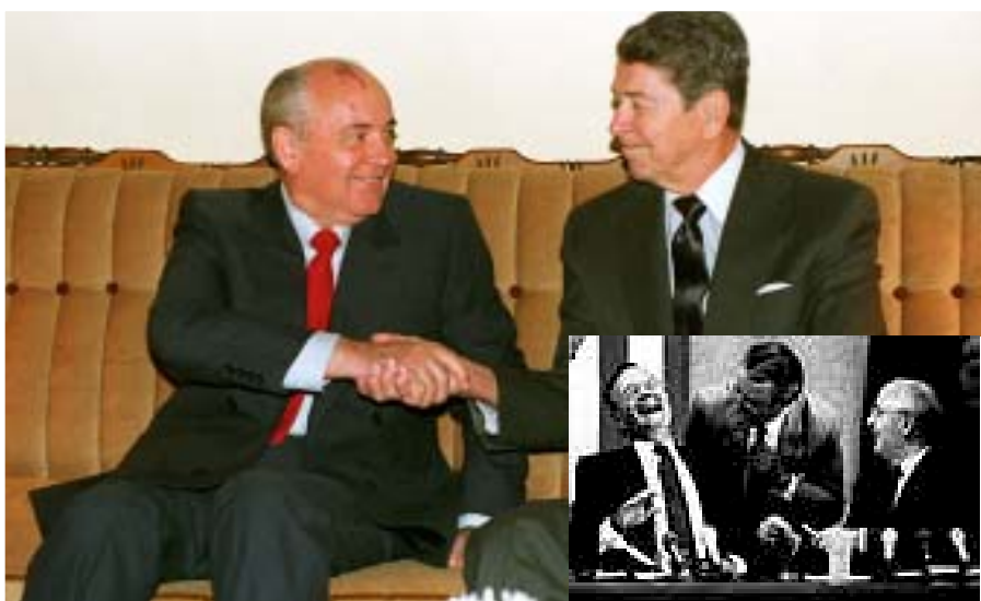
GORBACSOV RONALD REAGENEL MÉG EGYZEKEDETT, GEORGE BUSHAZONBAN MÁR AZT IS MEGKAPTA A SZOVJET ELNÖKTŐL, AMIRŐL ÁLMODNI SEM MERT VOLNA SOHA KORÁBBAN, A SZOCIALISTA TÁBOR FELADÁSÁT ÉS MAGÁT A SZOVJETUNIÓT

emberként és ünneplést hősként vett részt a kongresszuson. Az Antall-kormány 1991 augusztus végi döntése szerint a Munkáspártnak a Köztelek utcai székházából kellett költöznie a Baross utcai székház egy részébe. A megfélemlítés szándéka nyilvánvaló volt.