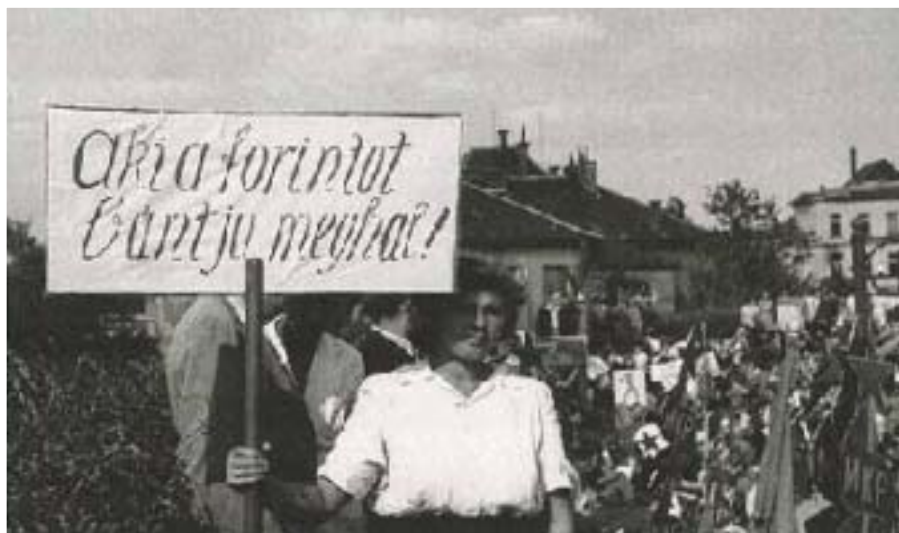
A MAGYAR KOMMUNISTA PÁRT TŰNTETÉSE AZ ÚJ FORINT VÉDELMEBEN

A pénzügyi stabilizáció befejező állomását az államháztartás 1946. január 1. és október 31. közötti viteléről szóló törvényjavaslat betervezése és 1946. július 31-én történt elfogadása jelentette (1946. XVII. tc.). Az értékálló pénz, a forint megteremtése lezárta a felszabadulást követő súlyos nehézségekkel terhelt inflációs időszakot, s egyben új szakaszt is nyitott a magyar népi demokrácia gazdasági életében.