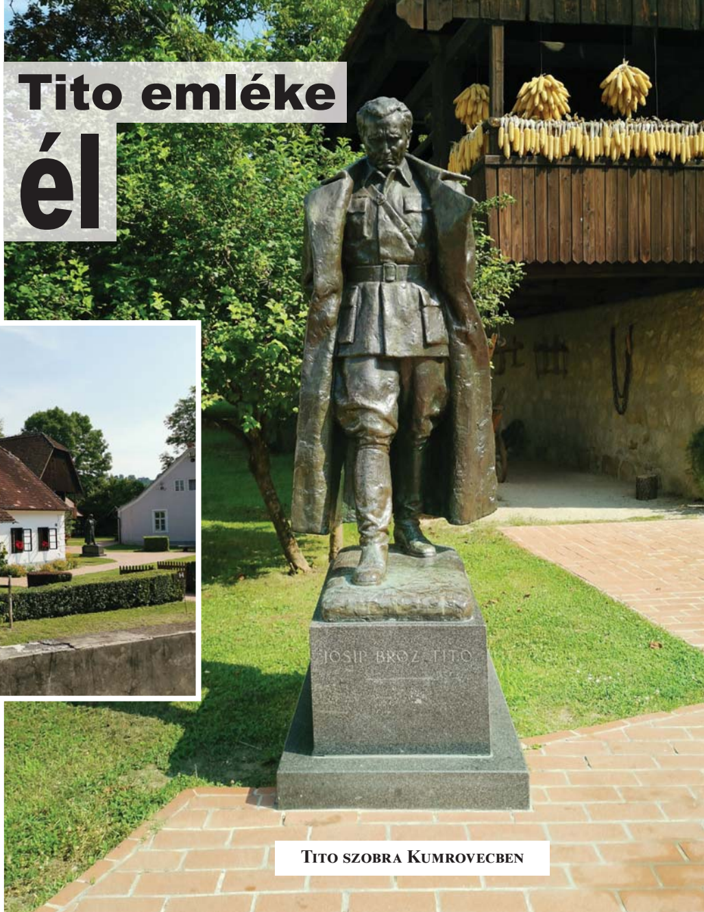
TITO SZOBRA KUMROVECEN