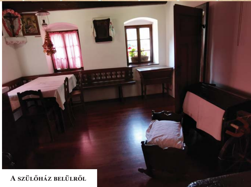
A SZÜLŐHÁZ BELÜLRŐL

A Magyar Munkáspárt központi politikai lapja. Szerkeszti a szerkesztőbizottság. Felelős szerkesztő: Frankfurter Zsuzsanna Szerkesztőség: 1046 Budapest, Munkácsy Mihály utca 51a.; telefon: (1) 787-8621; e-mail címe: info@aszabadsag.hu; internetcím: www.aszabadsag.hu Kiadja: a Munkáspárt, a kiadásért felelős: Thürmer Gyula, elnök. ISSN 0865-5146