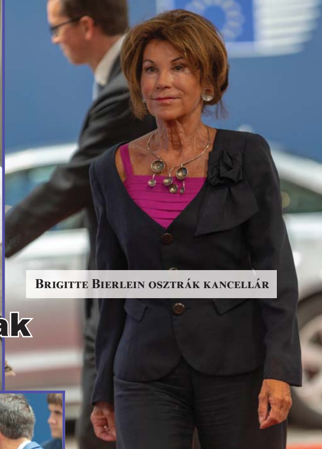
BRIGITTE BIERLEIN OSZTRÁK KANCELLÁR