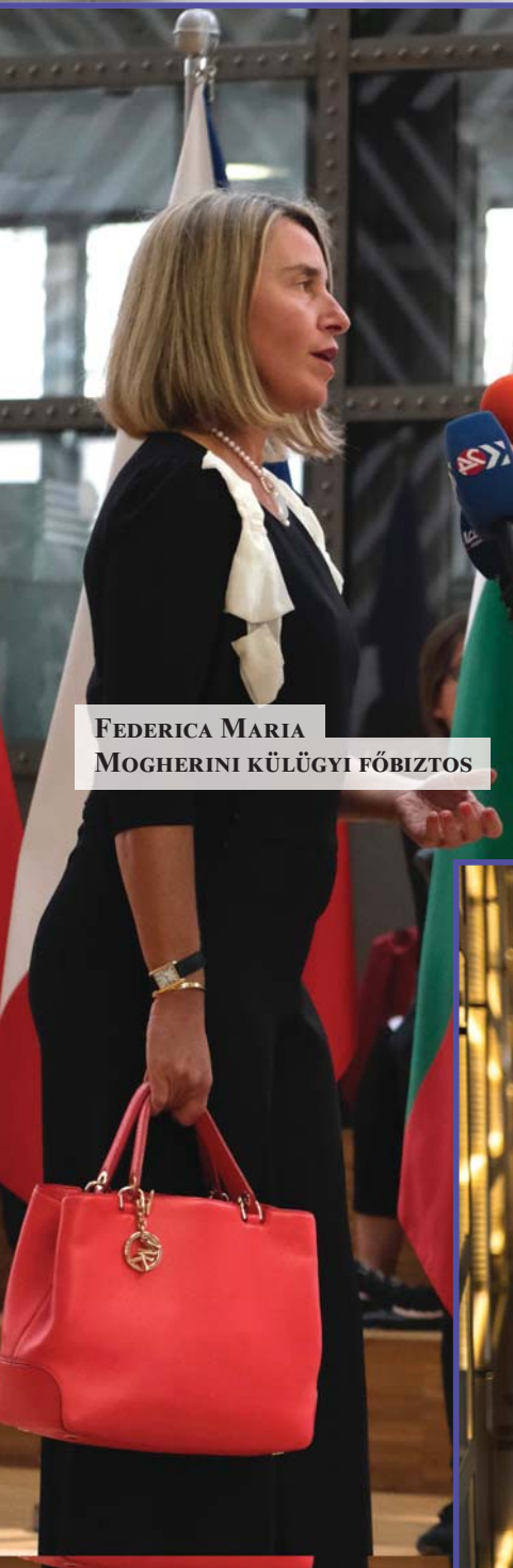
FEDERICA MARIA MOGHERINI KÜLÜGYI FŐBIZTOS