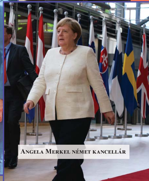
ANGELA MERKEL NÉMET KANCELLÁR

ORBÁN: NA, AZÉRT, EHHEZ LENNE NÉHÁNY SZAVAM!