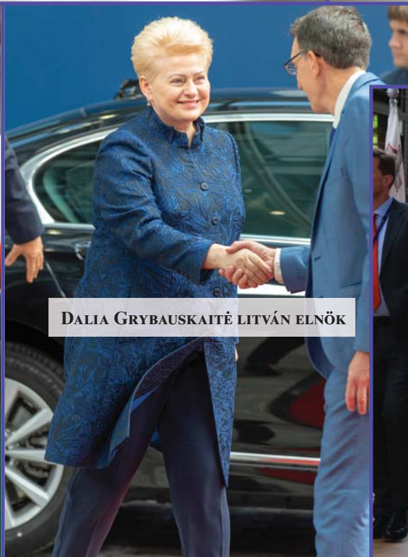
DALIA GRYBAUSKAITĖ LITVÁN ELNÖK