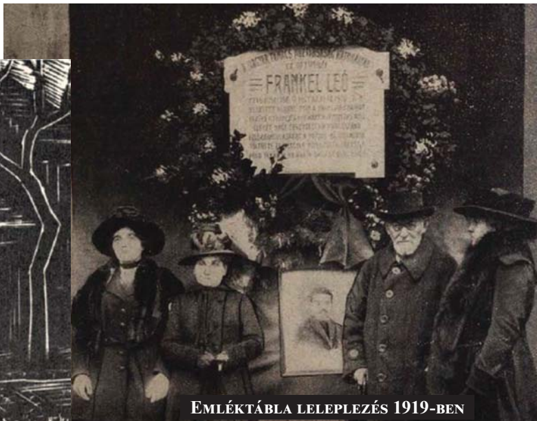
EMLÉKTÁBLA LELEPLEZÉS 1919-BEN