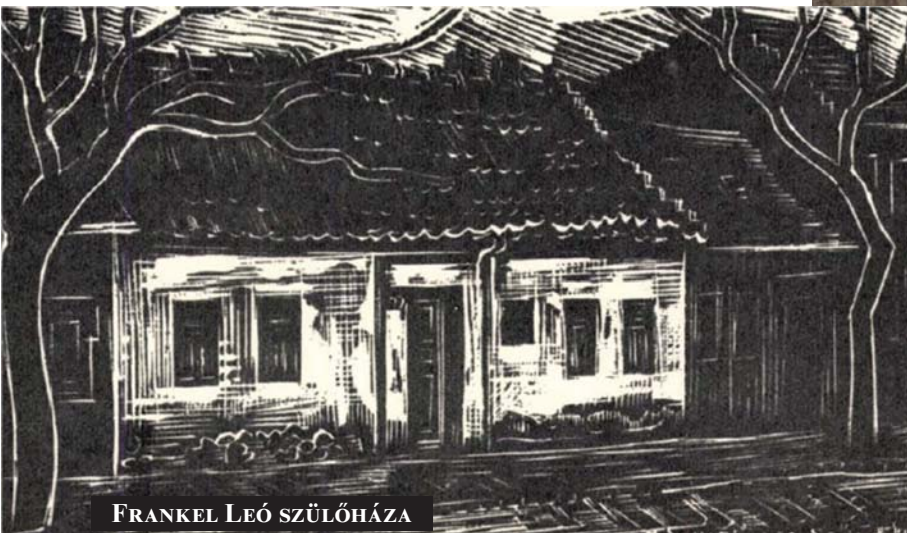
FRANKEL LEÓ SZÜLŐHÁZA

1883-ban Frankel így nyilatkozott egy német lapnak: „én nem áldoztam föl magamat, hanem csak kötelességemet teljesítettem és csak meggyőződésem, lelkiismeretem sugallatát követtem. Csak egy célnak élek, csak az egyenlőség magasztos eszméjének szerény előmozdítója akarok lenni.”