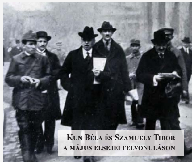
KUN BÉLA ÉS SZAMUELY TIBOR A MÁJUS ELSEJEI FELVONULÁSON