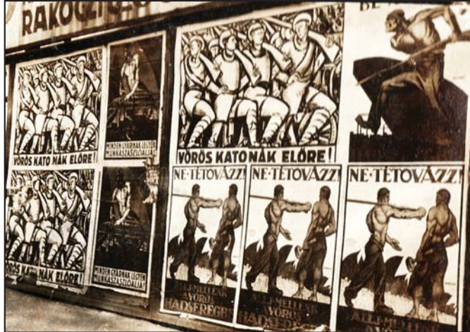
PLAKÁTOK MÁJUS ELSEJÉN