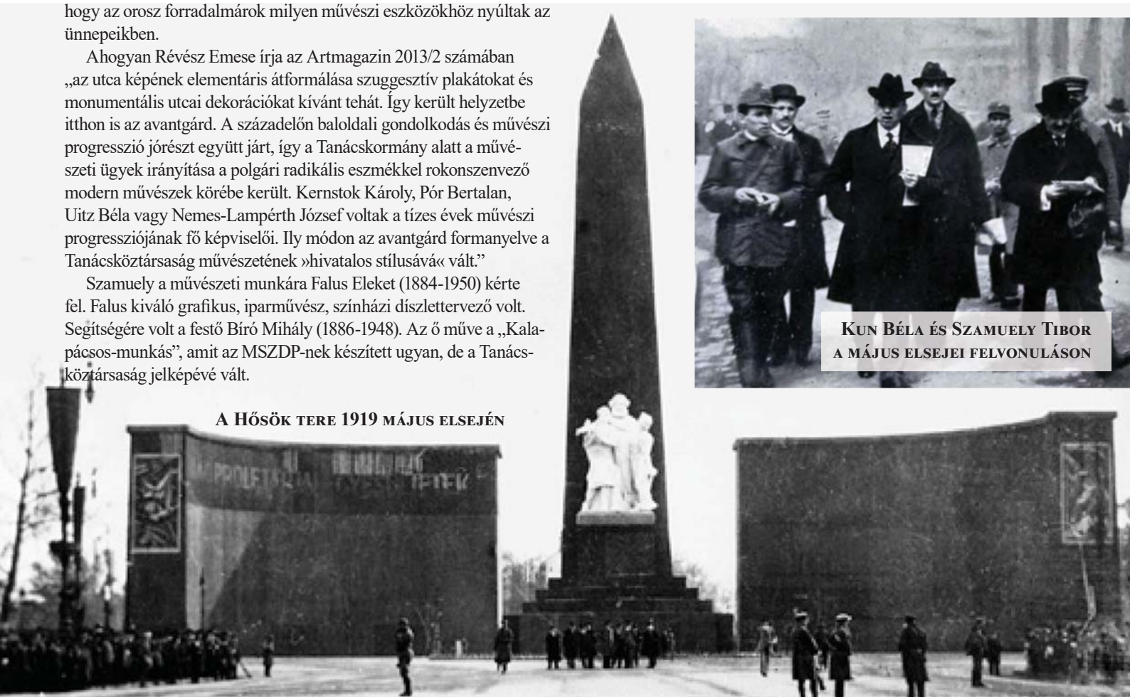
A HŐSÖK TERE 1919 MÁJUS ELSEJÉN

A Tanácsköztársaság avantgárd szobrai és installációi szakítottak a múlttal, egy új világ képét vázolták fel, ahol nem a királyok, császárok a hősök, hanem a dolgozó emberek. A korabeli fotókon kívül nem maradt ránk semmi. De az új világ nagyszerű eszméje tovább él.