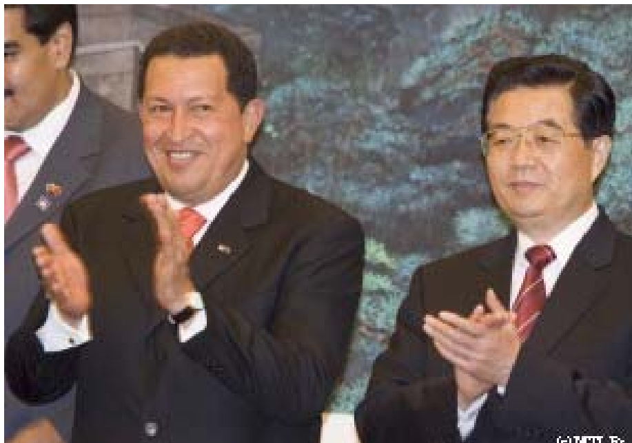
HUGO CHÁVEZ VENEZUELA ELNÖK HU JINTAO KÍNAI ELNÖKKEL, A KÍNAI KOMMUNISTA PÁRT ELSŐ TITKÁRÁVAL PEKINGBEN

"Mao Ce-tung forradalma fontosabb állomás volt az emberiség történetében, mint az ember Holdra lépése" - mondta Pekingbe érkezésekor adott nyilatkozatában Hugo Chávez. A venezuelai elnök augusztus 22-én este érkezett a kínai fővárosba, nyilatkozatát másnap közzölték a kínai lapok.