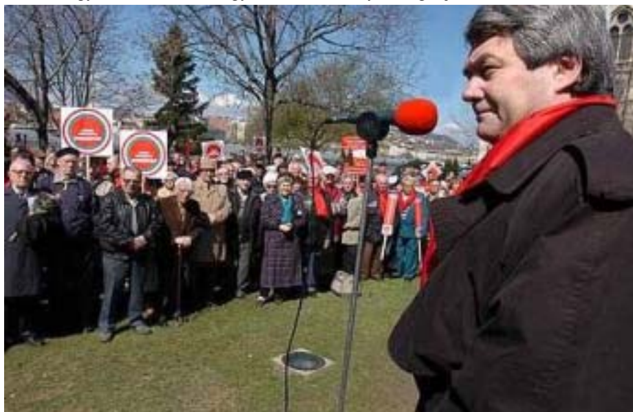
VOJTECH FILIP, A CSEH- ÉS MORVAORSZÁG KOMMUNISTA PÁRTJÁNAK ELNÖKE BESZÉDET MOND A MUNKÁSPÁRT KAMPÁNYZÁRÓ GYŰLÉSÉN A KOSSUTH LAJOS TÉREN, A JÓZSEF ATTILA-SZOBORNÁL. NEM LEHETTÜNK BÜSZKÉK MAGUNKRA, MÉG A FŐVÁROSI TAGJAINK TÖBBSÉGE SEM VOLT OTT. MINDEZ A SZERVEZETLENSÉGNEK AZ EREDMÉNYE.

Azonban igaz az is, hogy az állami támogatásból és más forrásokból a pártot mindeddig viszonylag kis tagdíj mellett is lehetett üzemeltetni, és nem alakult ki az a tudat, hogy a pártot nekünk kell eltartani. Az átlag tagdíj 150-200 forint között van, ami nem felel meg sem a tagság valós anyagi helyzetének, sem a követelményeknek. A párt vészkiáltására 620 fő jelentkezett eddig az Ezres Klubba. Ez szép, de még messze van az ezertől, ami egyébként is csak minimális könnyebbséget jelentene.