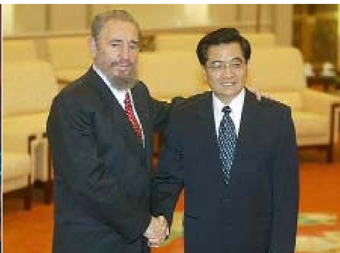
A KÉT BARÁTI SZOCIALISTA ORSZÁG: FIDEL CASTRO TALÁLKOZÁSA PEKINGBEN HU JIN TAO-VAL, A KÍNAI KOMMUNISTA PÁRT FŐTITKÁRÁVAL