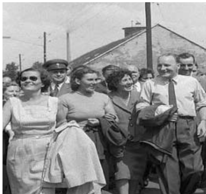
1959-BEN NAGYGYŰLÉST TARTOTTAK GYÖRBEEN AZ ALKOTMÁNY ÜNNEPÉNEK TISZTELETÉRE, MELYEN RÉSZTVEV KÁDÁR JÁNOS AZ MSZMP KB TITKÁRA.