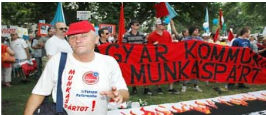
MUNKÁSPÁRTI AKTIVISTÁK A SZAKSZERVEZETEK TÜNTETÉSÉN