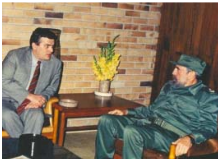
A MUNKÁSPÁRT MINDIG IS JÓ KAPCSOLATOKAT ÁPOLT A SZOCIALISTA KUBÁVAL. A KÉPEN FIDEL CASTRO FOGADJA THÜRMER GYULÁT AZ EGYIK HAVANNAI LÁTOGATÁSOKOR

A növekvő fenyegetettséggel szemben az állam sértetlensége, Latin-Amerika és a világ békéje és biztonsága ellen, mi aláírók követeljük, hogy az Amerikai Egyesült Államok kormánya tartsa tiszteletben Kuba függetlenségét. Minden áron meg kell akadályoznunk az új agressziót.