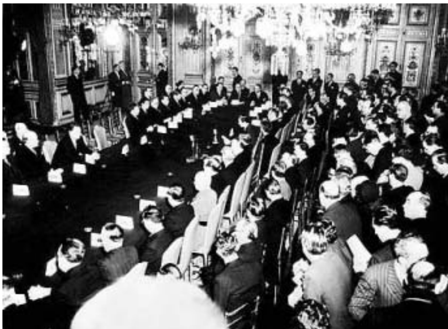
BÉKESZERZŐDÉS ALÁÍRÁSA A KÜLÜGYMINISZTERIUM ÓRASZALONJÁBAN, SZEMBEN A MAGYAR DELEGÁCIÓ.

A mai elit bajainak fő forrását Trianonban látja ("Csonka Magyarország nem ország, egész Magyarország mennyország"). Kevesebb szó esik azonban a párizsi békéről, melynek tárgyalásai 1946. július 29-én kezdődtek meg.