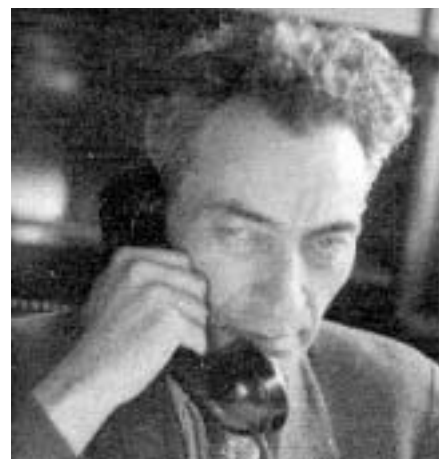
GERŐ ERNŐ, AKI A MAGYAR KOMMUNISTA PÁRTOT KÉPVISELTE A BÉKE-KONFERENCIÁN